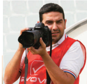
GIOVANNI ISOLINO fotografo