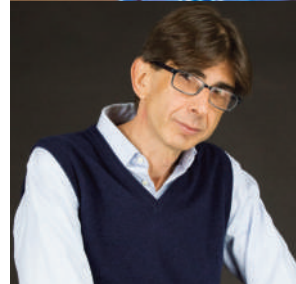
Giovanni PONTILLO autore