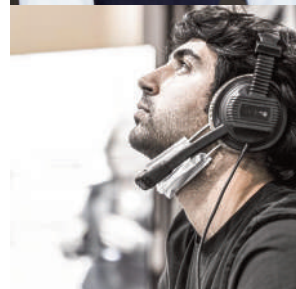
Antonio GRASSO regia